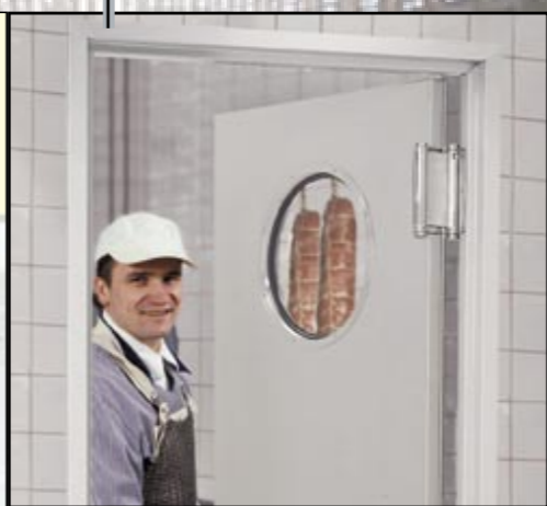
Metzgerei: In lebensmittelverarbeiteten Betrieben besonders geeignet.