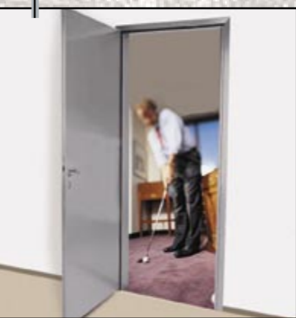
Chefzimmer: Modernes Design und hohe Wertigkeit.