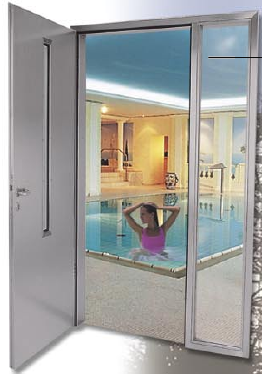
Hallenbad: Edelstahl rostfrei - In Feuchträumen auf Dauer korrosionsbeständig.

Der vielseitige Einsatzbereich von Edelstahl kennt praktisch keine Grenzen - ob im Hygiene-, im Sanitärbereich, in der Lebensmittelproduktion, in der Metzgerei oder in Reinräumen ist Edelstahl nahezu ideal.