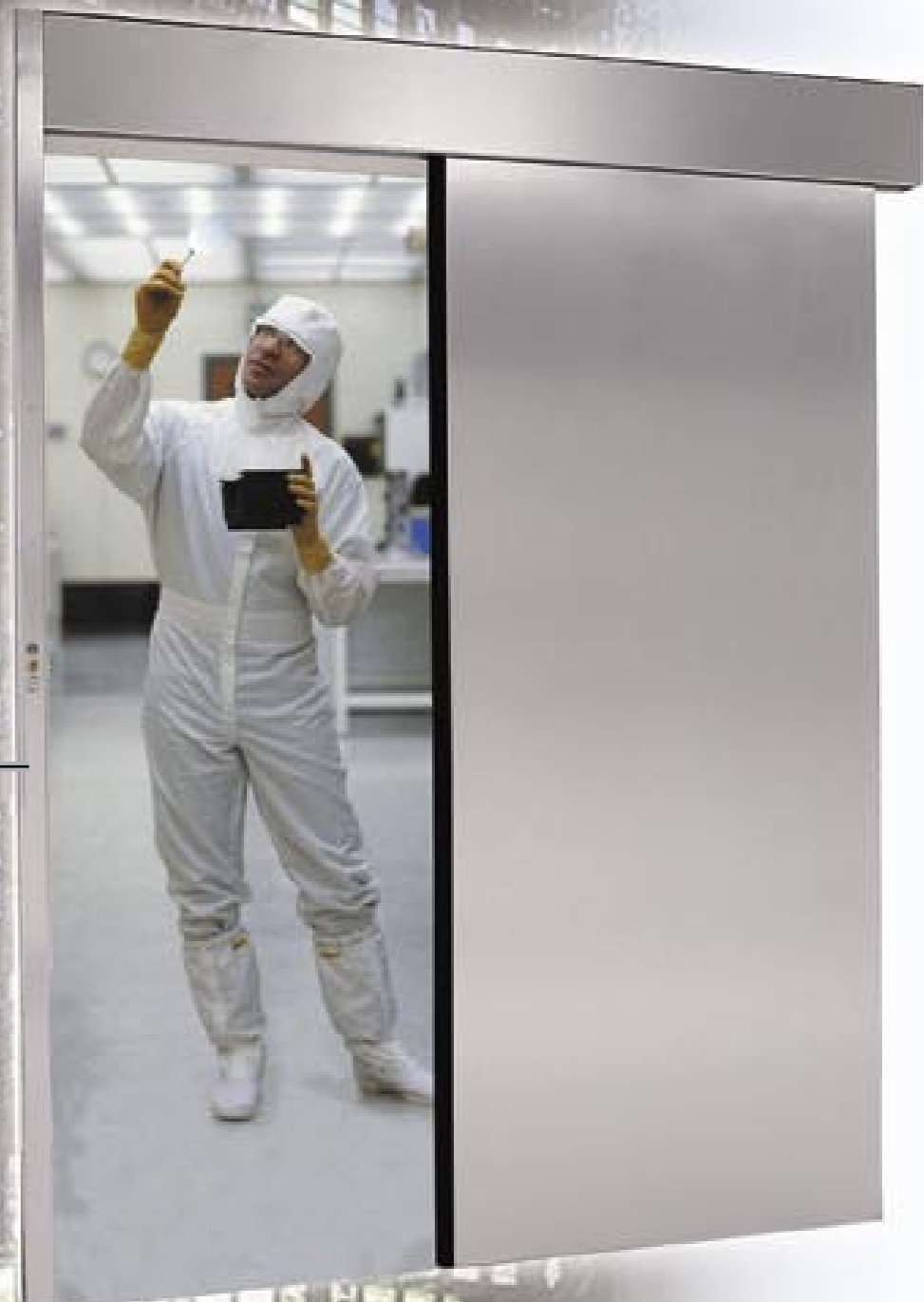
Reinraum: Für höchste Hygieneansprüche mit Edelstahl rostfrei.